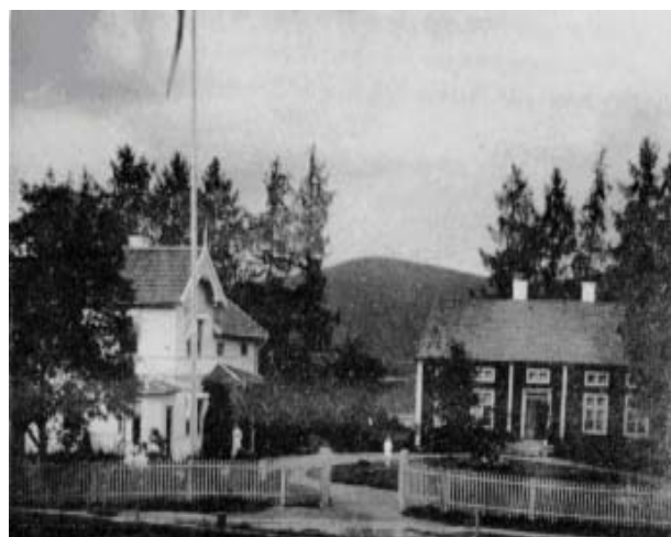
Framsidesbilden på första byskivan, för Magdbyn: Norrmans i Magdbyn.

BHF har börjat utarbeta byskivor för byarna i Borgsjö socken. Innehållet