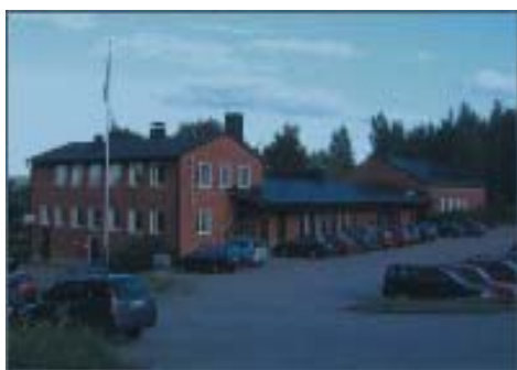
MGFs lokal i Kusten FH där DIS-MITT hyr in sig och har sitt huvudsäte för styrelsemöten. Kusten ligger nära E4 i Stockvik.

Vi samlas i släktforskar-lokalen i Folkets Hus Kusten i Stockvik strax söder om Sundsvall efter kl 11.00