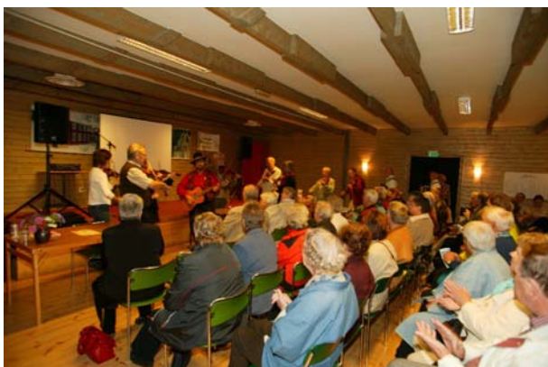
Medelpads spelmans förbund