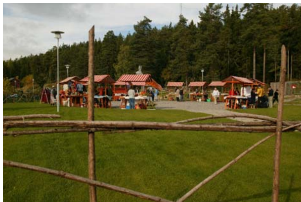
Höstmarknaden pågår för fullt