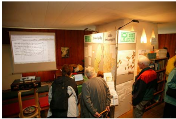
Visningshörnan hos DIS-Mitt