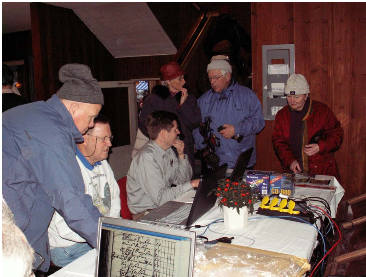
Bild från Julmarknaden i Sundsvall 3-4/12. Här visade MGF och Dis-Mitt släktforskning på nätet och det fanns möjligheter att bli köpa Disgen på plats.